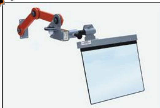
Protezione per Mole e Macchine varie